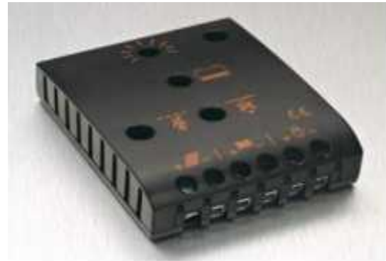
Gambar 4. Konstruksi regulator Baterai

Gambar 4 adalah konstruksi dari regulator baterai. Regulator baterai adalah alat yang mengatur pengisian arus listrik dari modul surya ke baterai/aki dan sebaliknya. Saat isi baterai tersisa 20% sampai 30%, maka regulator akan memutuskan dengan beban. Regulator baterai juga mengatur kelebihan mengisi baterai dan kelebihan tegangan dari modul surya. Manfaat dari alat ini juga untuk menghindari fulldischarge dan overloading serta memonitor suhu baterai. Kelebihan tegangan dan pengisian dapat mengurangi umur baterai. Regulator baterai dilengkapi dengan diode protection yang menghindarkan arus DC dari baterai agar tidak masuk ke panel surya lagi.