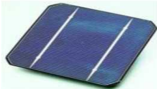
Gambar 2. Panel surya