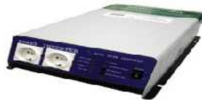
Gambar 5. Konstruksi inverter

Inverter adalah alat yang mengubah arus DC menjadi AC sesuai dengan kebutuhan peralatan listrik yang digunakan. Alat ini mengubah arus DC dari panel surya menjadi arus AC untuk kebutuhan beban-beban yang menggunakan arus AC. Konstruksi inverter dapat dilihat seperti Gambar 5.