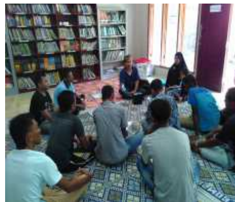
Gambar 1. Tim pelaksana menyampaikan materi pemanfaatan energi surya

Dalam metode ini peserta mendengarkan sekaligus melakukan tanya jawab tentang materi yang disampaikan sehingga bisa diukur sejauh mana penguasaan peserta tentang materi yang diberikan. Dari hasil tanya jawab tersebut pemateri menyimpulkan hampir 100% peserta telah memahami dan mengerti tentang materi yang disampaikan tersebut. Peserta sangat suka dengan materi pelatihan yang disampaikan karena materi tersebut dapat membuka wawasan mereka tentang pemanfaatan sinar matahari yang bisa menjadi sumber energi alternative.